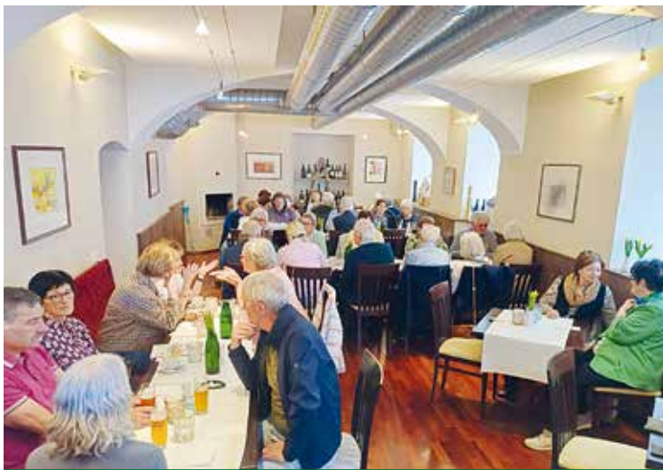
St. Veit: Volles Haus beim 4. Clubnachmittag im April.