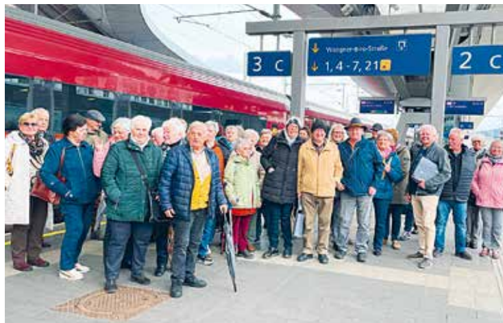
Steindorf: Graz rückt näher – Bahnfahrt durch den Koralmtunnel.

Nach zeitaufwendigen Vorbereitungen mit der Buchung von ÖBB-Tickets für über 40 Senioren ging es im März mit der Koralmbahn von Feldkirchen über Villach nach Graz. Die Erwartungen waren groß, da viele Senioren jahrelang nicht mehr mit dem Zug gefahren sind. Viel zu schnell in Graz angekommen, ging es mit der Straßenbahn weiter zum Hauptplatz.