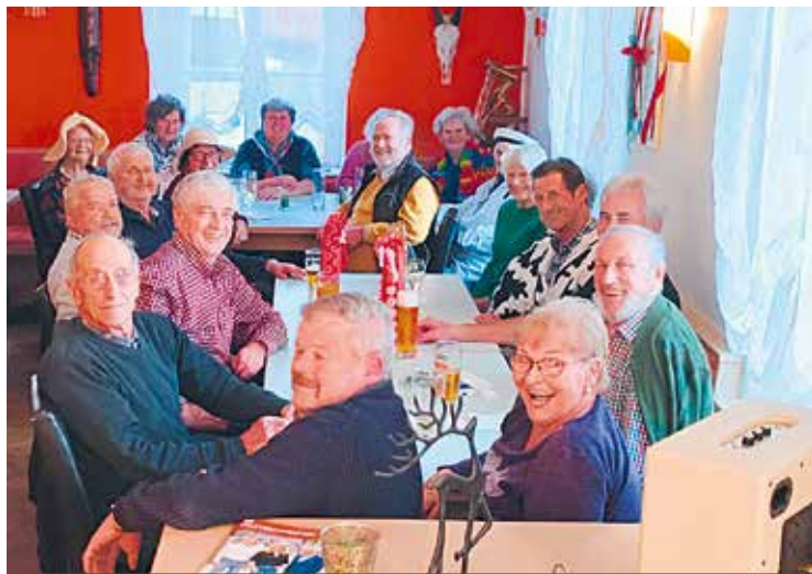
Tigring: Feier in gemütlicher Runde.