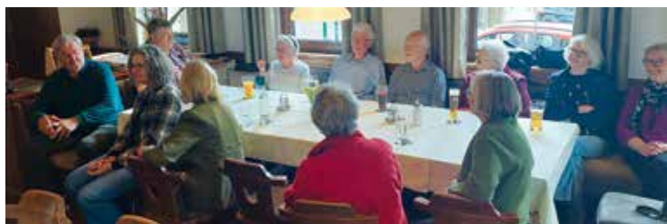
Albeck-Sirnitz: Viele Angebote für die Senioren beim Seniorenbund.