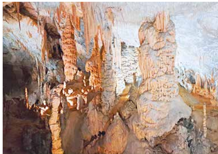
Kötschach-Mauthen: Stalagmit Brilliant, das Symbol der Postojnahöhle.

Von dort aus konnte jeder frei die Altstadt mit ihren Sehenswürdigkeiten besichtigen. Mit steirischen Schmankerln in diversen Lokalen gestärkt und voller schöner Eindrücke traten wir abends mit einstündiger Verspätung die Heimreise an.