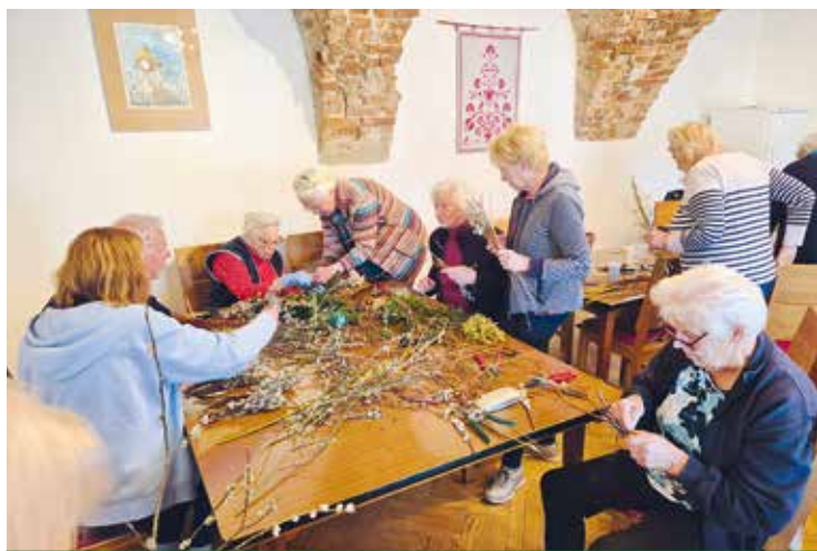
St. Paul: Alte Flechttechnik beim Palmbuschen binden wurde gezeigt und gelernt.