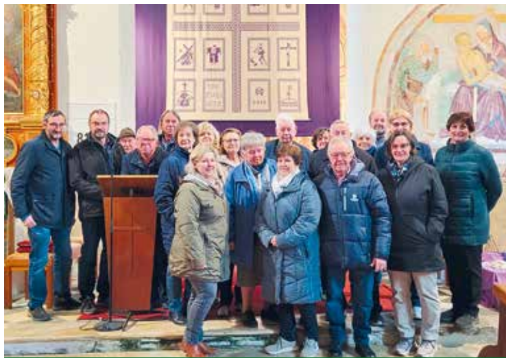
Zweinitz: Kirchliche Bräuche werden gepflegt.