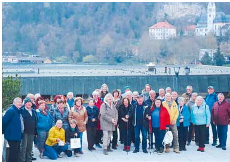
Kötschach-Mauthen: Am See in Bled.