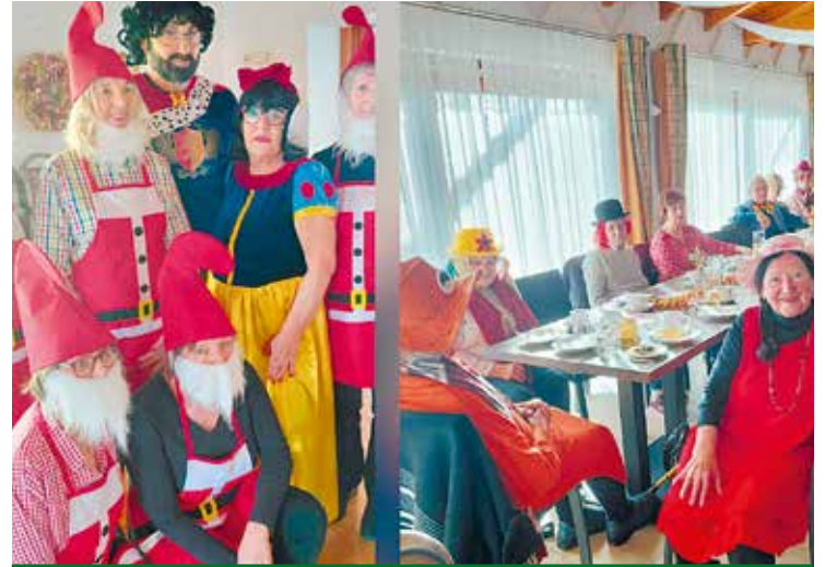
Kühnsdorf: Die Tanzgruppe in originellen Kostümen.