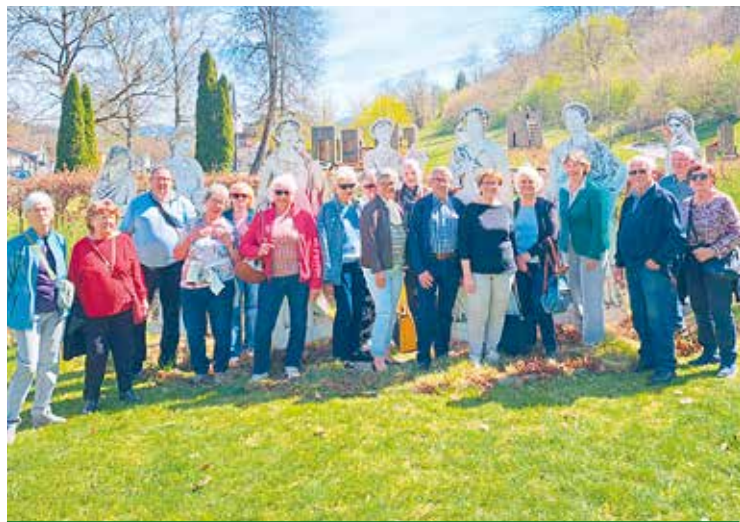
Moosburg: Die Gruppe vor den 9 Musen.