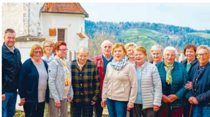
Granitztal: Gemeinsame Arbeit für die Senioren.

Mit dem Frühlingsbeginn am 21. März lud der Seniorenbund Granitztal zu einem gemütlichen und zugleich informativen Treffen in den Pfarrhof der Pfarre St. Martin. Zahlrei-