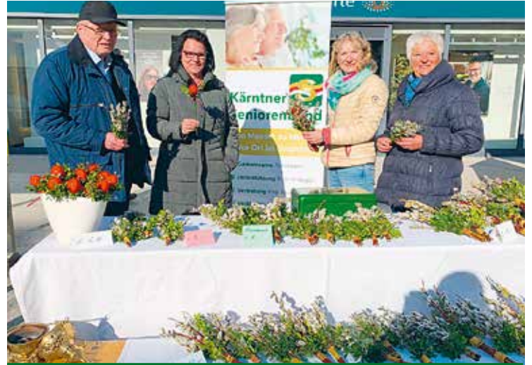
Völkermarkt: Erfolgreicher Verkauf der gebundenen Palmbuschen.