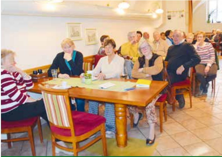
Obervellach: Gut besuchte Jahreshauptversammlung.