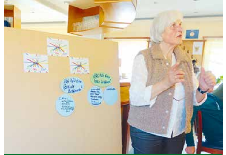
Dellach/Drau: Viele bedeutende Gedanken zur Gemeinsamkeit.

Nach dem Essen des traditionellen Gerichts der Region, dem ausgezeichneten Schaflaufbraten, sahen wir noch einen kurzen Filmbericht über das alte Brauchtum der Prangstangen und die besondere Bedeutung, die dieses Ritual für die Bevölkerung von Zederhaus besitzt. Die farbenprächtigen Bilder und die Einblicke in die Vorberei-