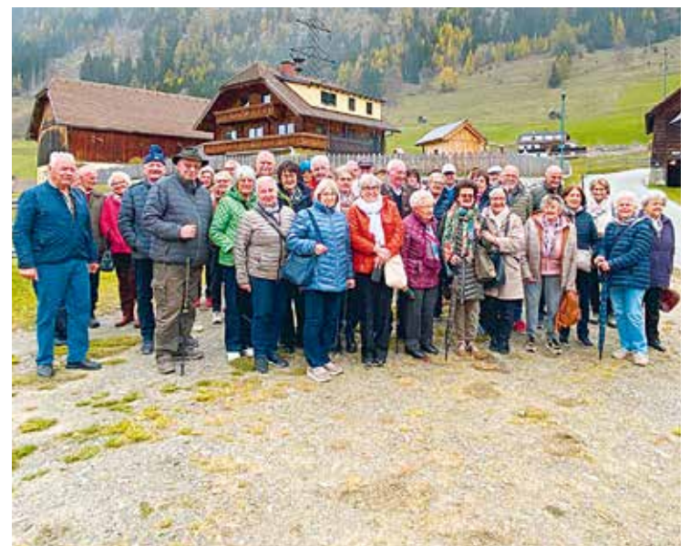
Gmünd: Interessante Besichtigungen in Zederhaus.

An der Veranstaltung nahmen 35 Senioren und Seniorinnen teil, die großes Interesse zeigten und zahlreiche Fragen stellten. Der informative Nachmittag klang bei Kaffee und Kuchen in angenehmer Atmosphäre aus.