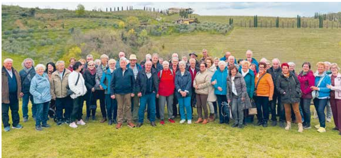
Seeboden: In der „slowenischen Toskana“, in Goriška-Brda.