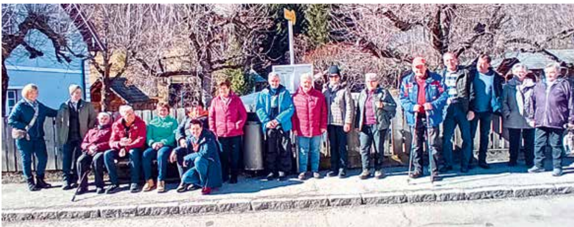
Rennweg: Start zum Wandertag zur Pritzhütte.

Für Notfälle: „Das Fluchen an sich ist nicht schicklich, doch