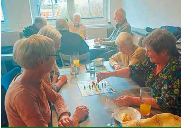
Deutsch-Griffen: Gewinnen und verlieren beim Spielenachmittag im April