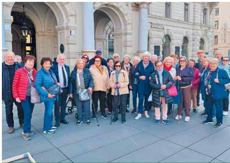
Klagenfurt Ost: Führung im Grazer Rathaus und in der Altstadt.