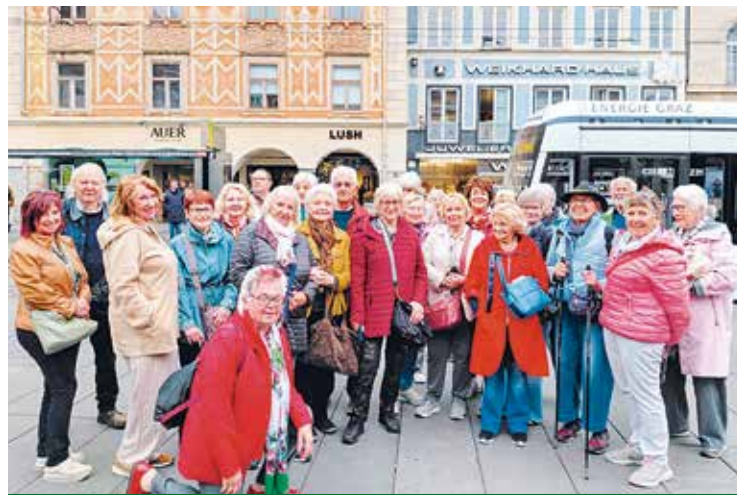
Annabichl: Mit der Koralmbahn verkürzt sich die Fahrzeit zwischen Klagenfurt und Graz erheblich.