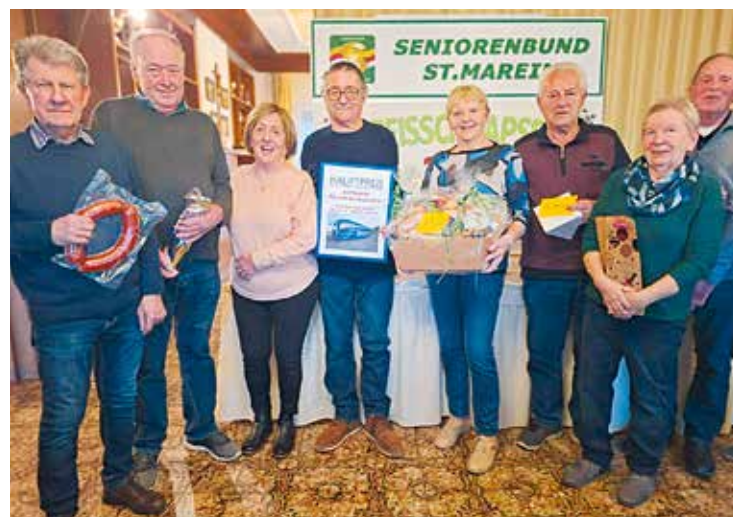
St. Marein: Die glücklichen Gewinner des traditionellen Preisschnapsens.

Für den ersten Preis spendete die Firma Lassing aus Griffen eine Busreise nach Laibach zum Besuch des Ostermarktes. Der