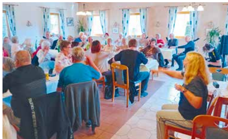
St. Georgen/Längsee: Aktive Senioren mit Übungen beim Sitzen.