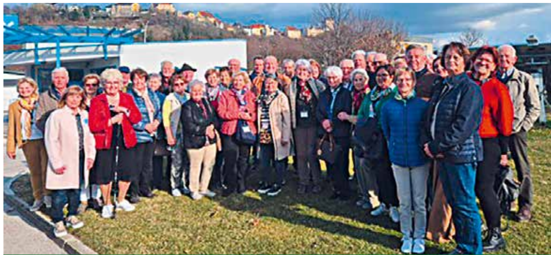
Kappel am Krappfeld: Betriebsbesichtigung Firma Flex Althofen.