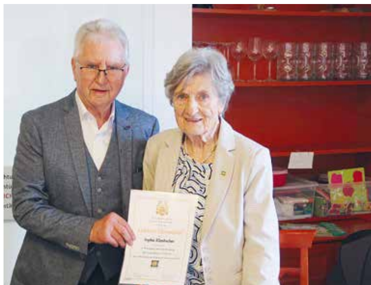
St. Georgen/Lav.: Große Freude über die verdiente Auszeichnung.

Ende März führte eine gemeinsame Fahrt eine große Anzahl von Mitgliedern in die Oststeiermark, wo man im Wasserschloss Burgau eine umfangreiche Osterausstellung besuchen, viele Eindrücke sammeln sowie Ideen für dekorativen Osterschmuck mitnehmen konnte.