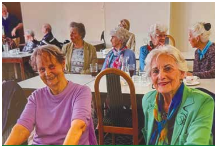
Klagenfurt West: Großes Interesse beim Vortrag über das Erkennen von Notfallsituationen.