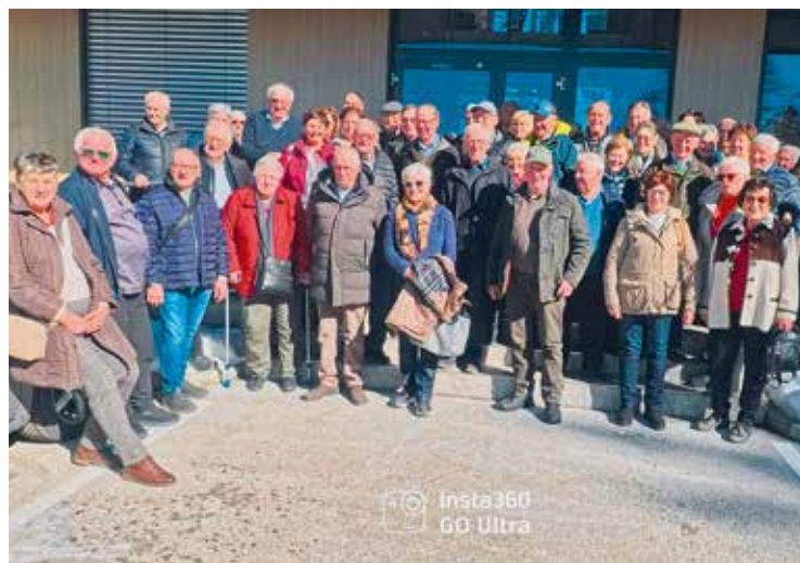
Wolfsberg: Werksbesuch bei der Firma Konrad.