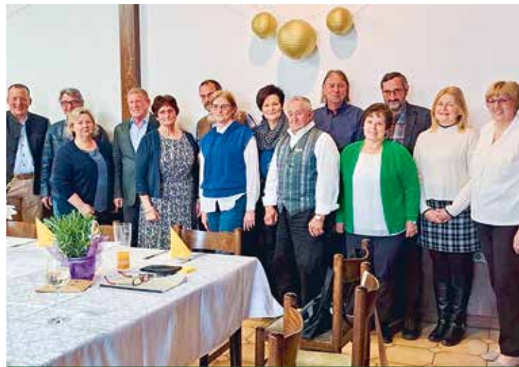
Zweinitz: Der neu gewählte Vorstand.

unter dem Thema „Workout mit Stuhl“ für die Senioren eine unterhaltsame Stunde mit Übungen im Sitzen veranstaltete. Diese Übungen wurden von den Senioren mit viel Spaß und Gelächter mitgemacht. Da konnte Mann/Frau sehen, mit welchen einfachen Übungen man in kurzer Zeit sehr viel für das Wohlbefinden, Kreislauf und Muskulatur getan werden kann. Anschließend klang der Nach-