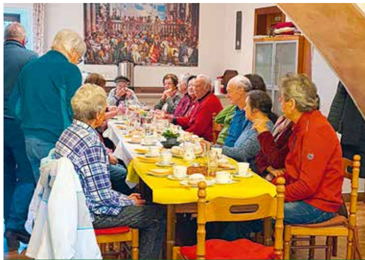
Millstatt: Liebe zum Räuchern.