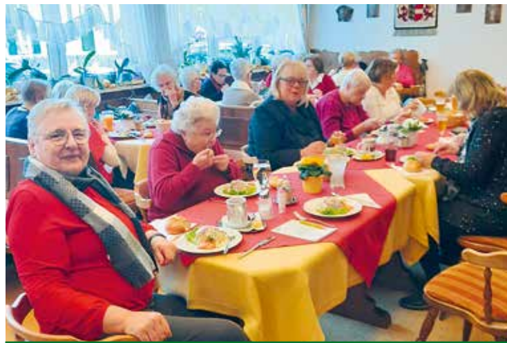
Velden: Viel Spaß hatten die Seniorinnen beim gemeinsamen Heringschmaus.

Am Nachmittag besuchten wir den Dom „Maria Assunta“. Der ehemalige Bürgermeister von Gemona erzählte uns viel aus der