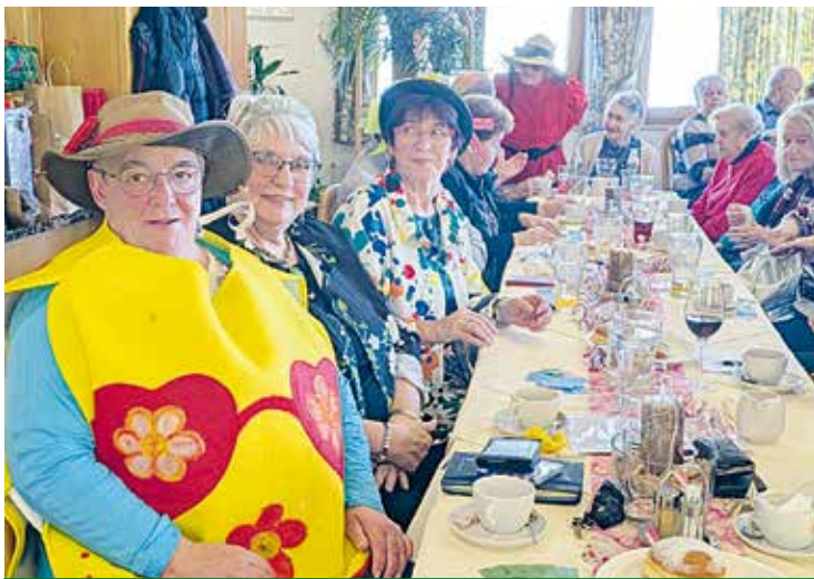
Dellach/Gail: Seniorengemeinschaft – das ganze Jahr über.