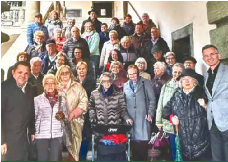
Völkermarkt: Ein Zentrum der Demokratie zum Kennenlernen.

lach. Das vielfältige Angebot wurde rege genutzt, und auch die kulinarischen Möglichkeiten fanden großen Anklang. Nach dem Passionskonzert am 28. März in der Pfarrkirche St. Kanzian bot unsere Ortsgruppe ein umfangreiches Kuchenbuffet für einen wohltätigen Zweck an.