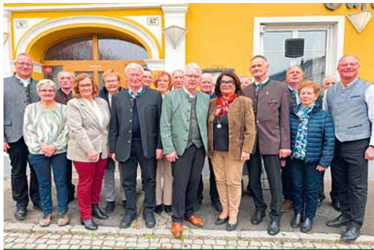
Bad St. Leonhard: Ehrengäste und Ausschussmitglieder bei der Jubiläumsveranstaltung.