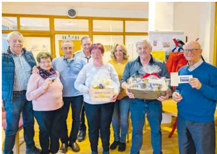
Frantschach-St.Gertraud: Senioren sind Profis beim Kartenspielen.