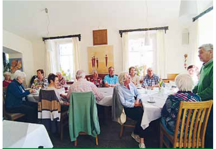
Reißeck/Mühldorf: Interessanter Vortrag zum Thema Hausapotheke.