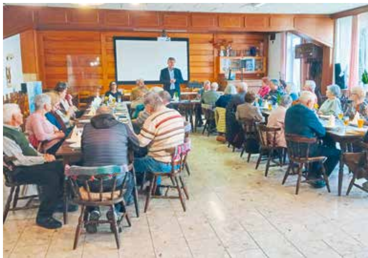
Ruden: Vorschau bei der Jahreshauptversammlung.

verfasste Gedanken zum Besten gegeben. Einen Ausblick auf die laufenden Vorbereitungen für das Grillfest am 3. Mai, sowie für den Muttertagausflug mit der Bahn nach Graz ist sehr positiv von den Mitgliedern aufgenommen worden.