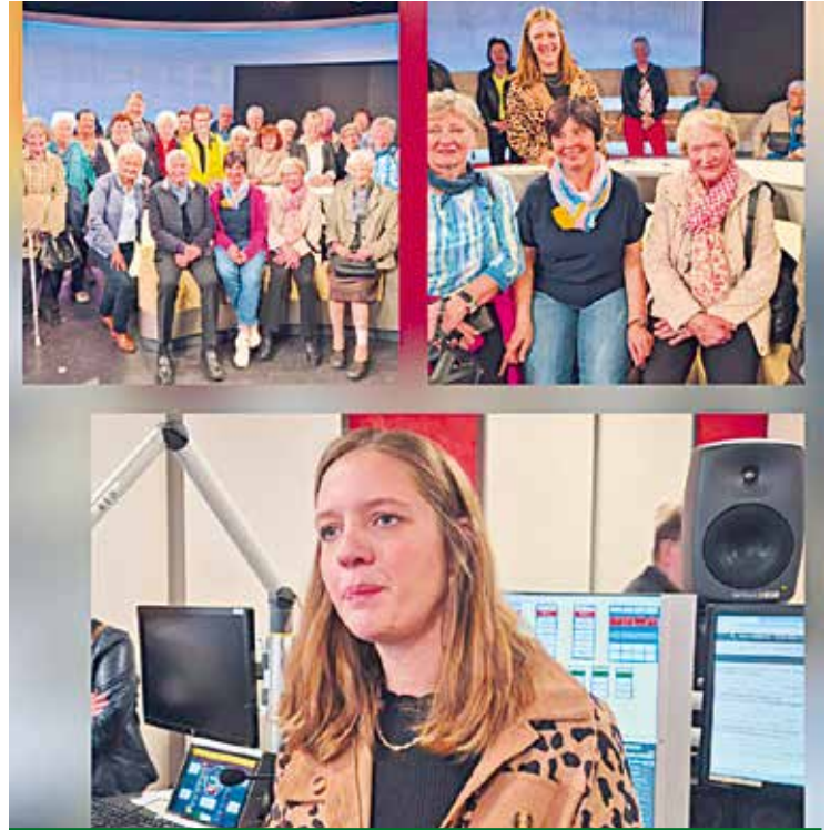
Maria Saal: Großes Interesse gab es für die Live-Produktionen des ORF-Landesstudios Kärnten.