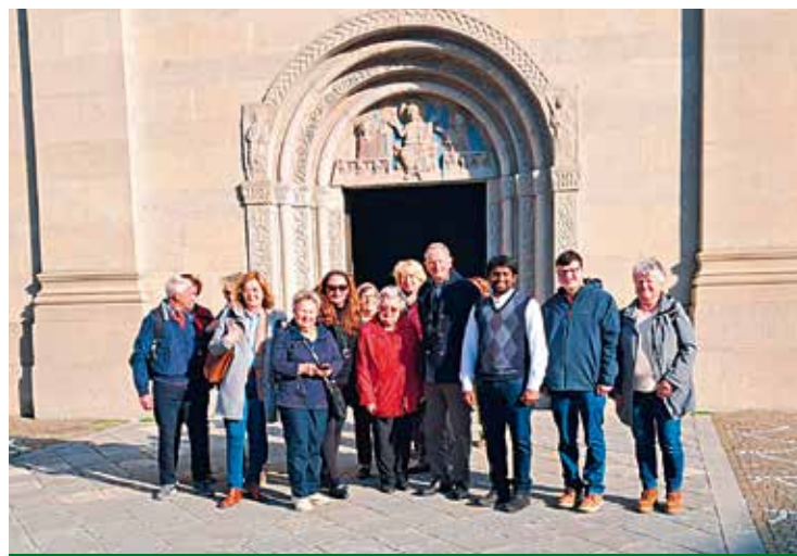
Velden: Pfarrausflug in die Partnerstadt Gemona del Friuli.